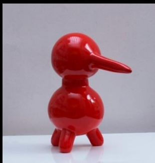
Petits envols, Résine, 2009/2010 ht 8/15/25 cm