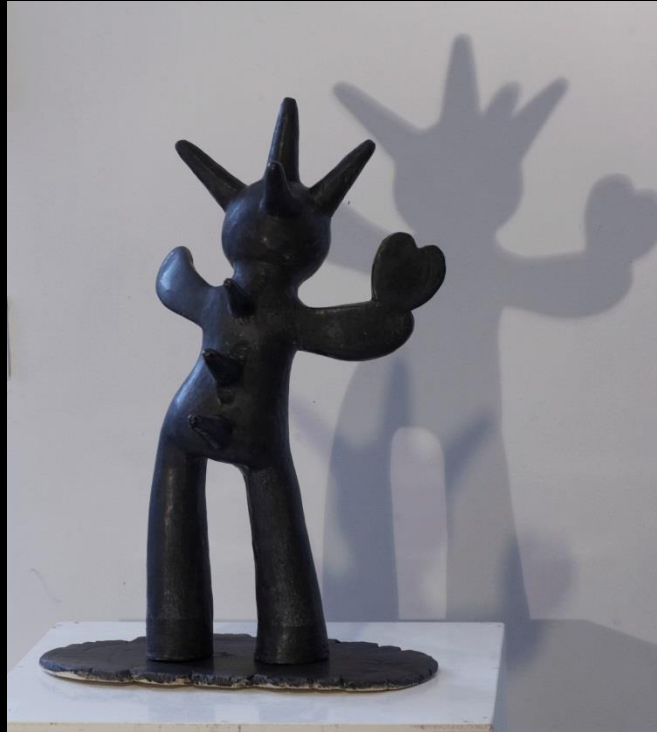
Love is a chemical réaction, grès chamotte, émail noir satiné, ht 45 x 27 cm sur socle plat 34 x 18 cm, 2013