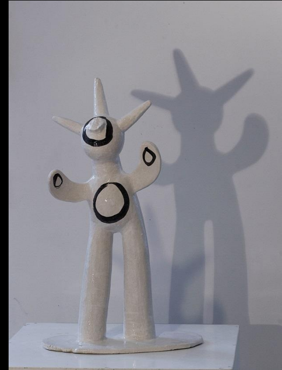
1 Love is a chemical réaction - grès chamotte, émail blanc, tracé engobe noire, ht 50 x 20 cm socle plat 28 x 13 cm, 2013