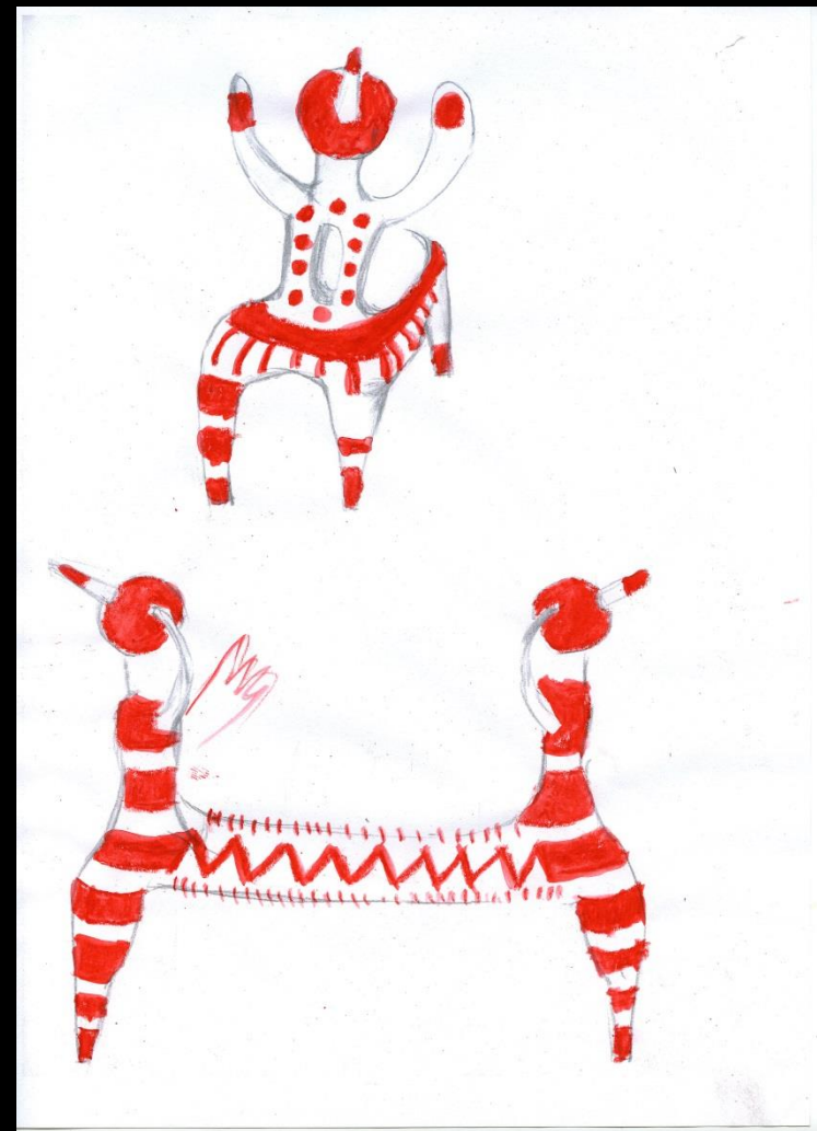
Maquette, 65 cm, 2013 pour mobilier urbain, en vue d'un agrandissement résine