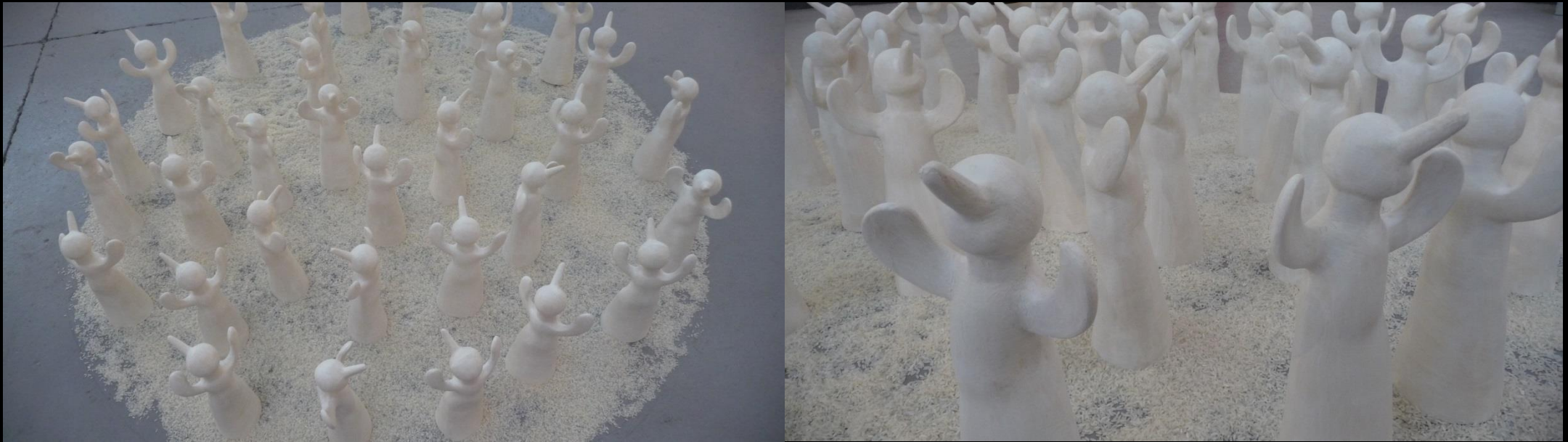
Installation de 34 envols blanc , grès engobé,. Pièces exposée à la Galerie Artistic Garage en 2013.