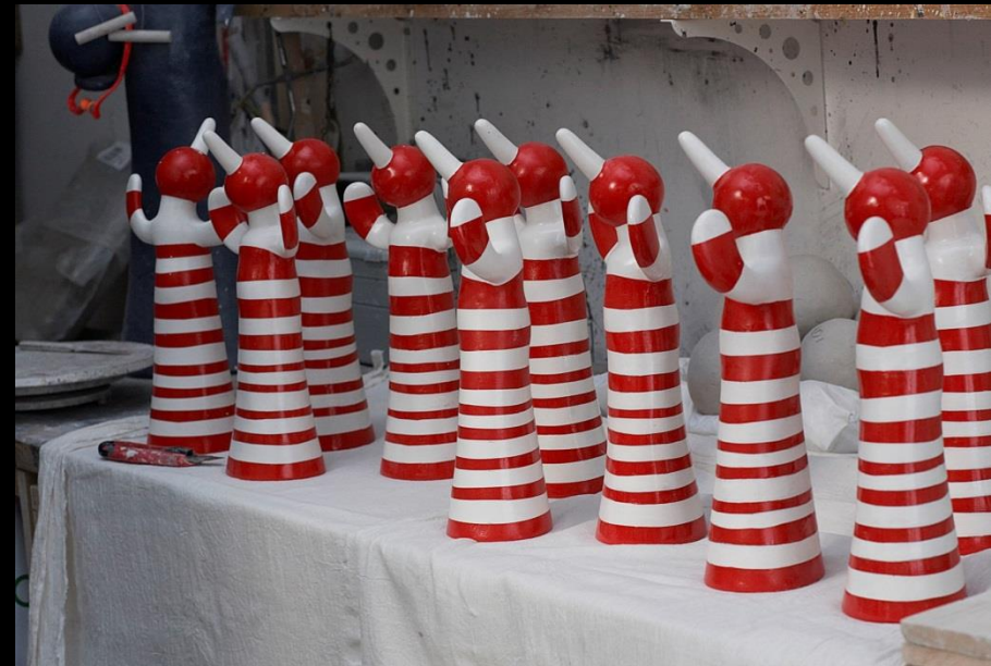
Ci-dessus : Edition, Petit Envol Rouge et Blanc, 2013, Résine, 30 cm Chaque exemplaire est signé et numéroté.