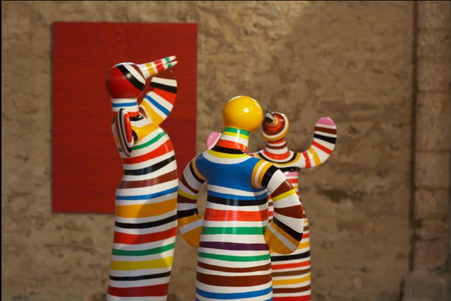
Triptyque, Envol multicolore , 2009, Résine Exposition 2012, Eglise Saint Jacques de Dival