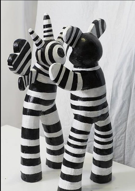
Love is a chemical reaction 1 & 2 Grès et engobe sous couverte brillante 58/28 et 55/25 cm, 2012