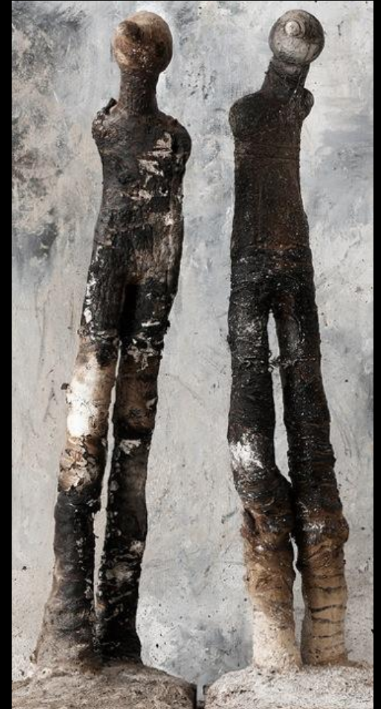
Matières Calcinées, 2007/2008 Technique mixte et patines sur grès Ht 35/55/75 cm