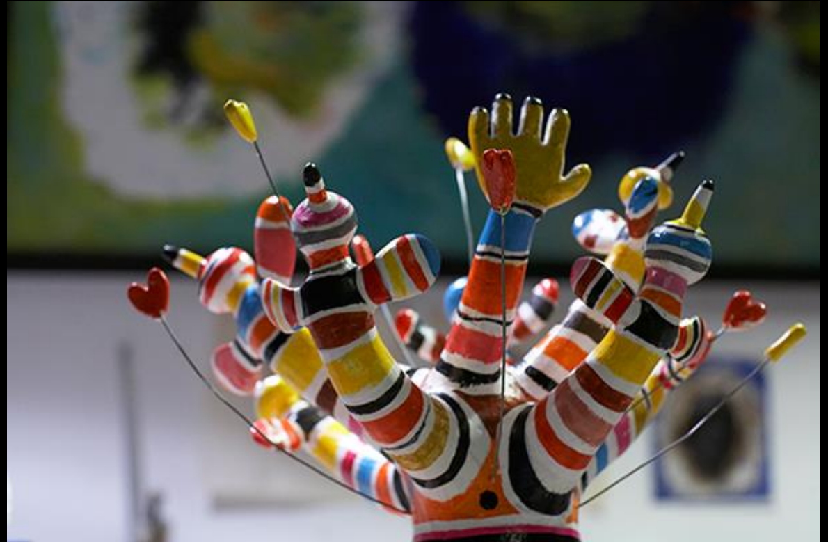
Maquette, 60 cm, pièce unique, 2012 Réponse au concours international de la Fondation Murcia Futuro (Espagne) et de la Fondation Gabarron (USA) pour le pac Levante à Murcia, Espagne.