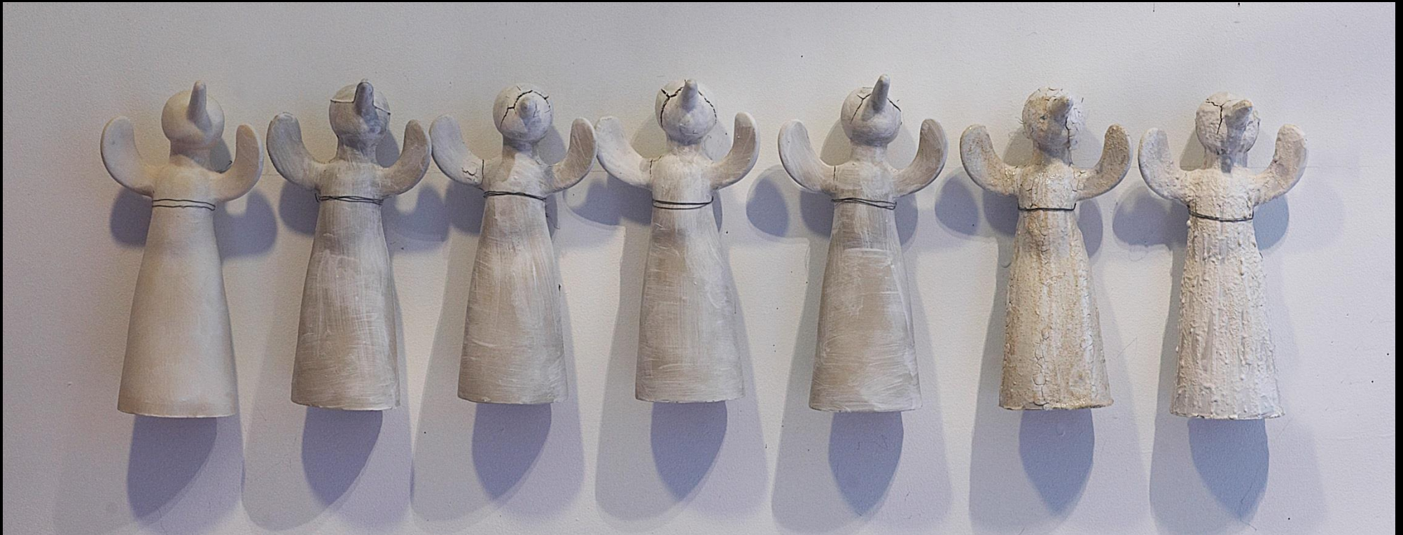
Installation de 7 Envols, 2014 Réponse au concours organisé par Z Space, San Francisco