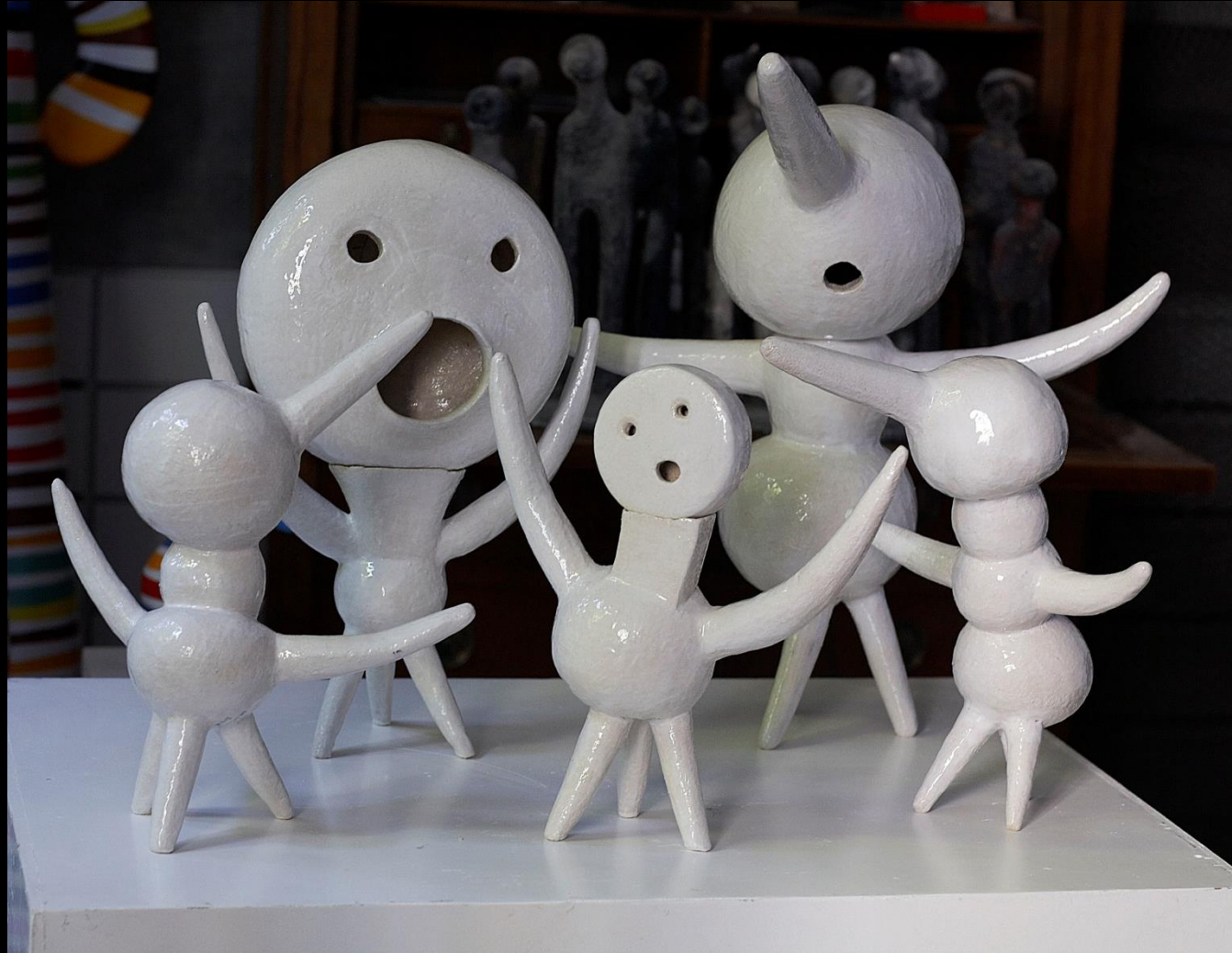
1. Série Blanche 2013, Sans Titres, grès émaillé 33 cm à 55 cm