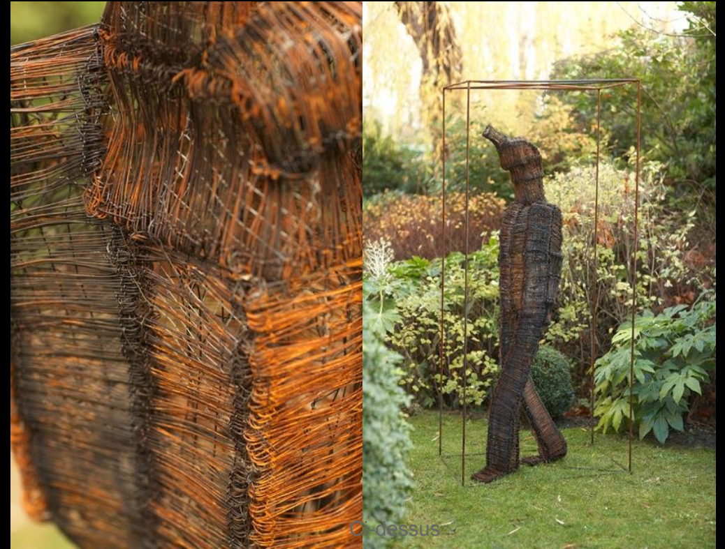
Personnage , Fil de fer, 2009 Exposée au musée des Avelines Actuellement dans un jardin particulier ht 200 cm base 70 x 90 cm