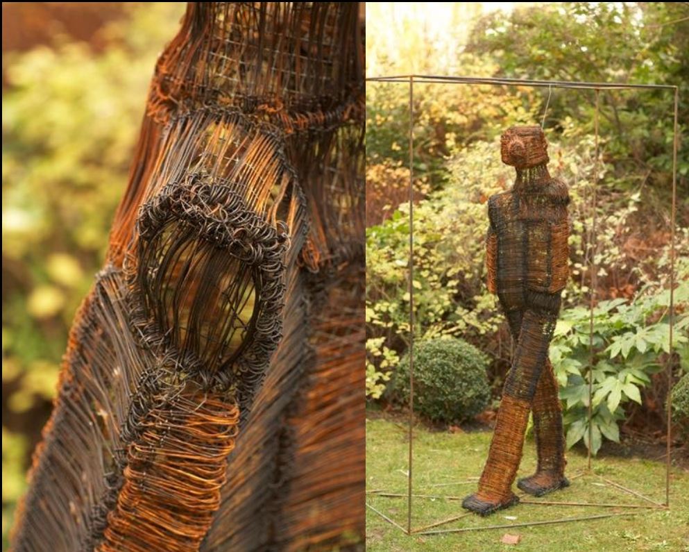
Le marcheur , Fil de Fer, 2009 Exposée au musée des Avelines Actuellement dans un jardin particulier Ht 185 cm Base 72 x 120 cm