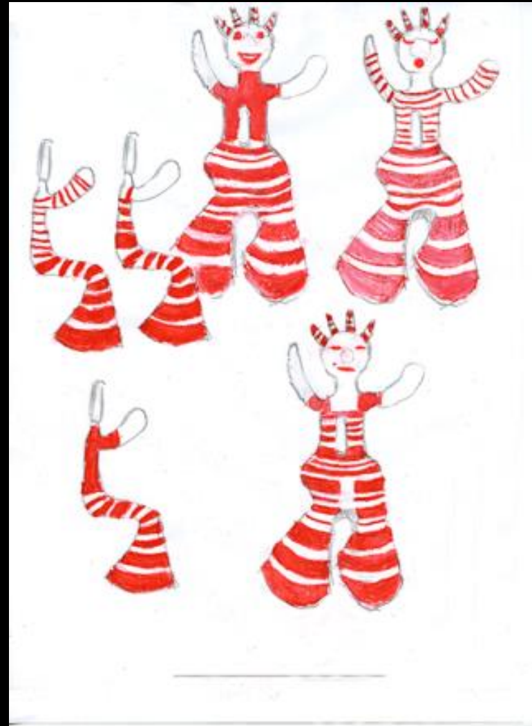
Maquette, 63 cm, 2013 pour mobilier urbain, en vue d'un agrandissement résine